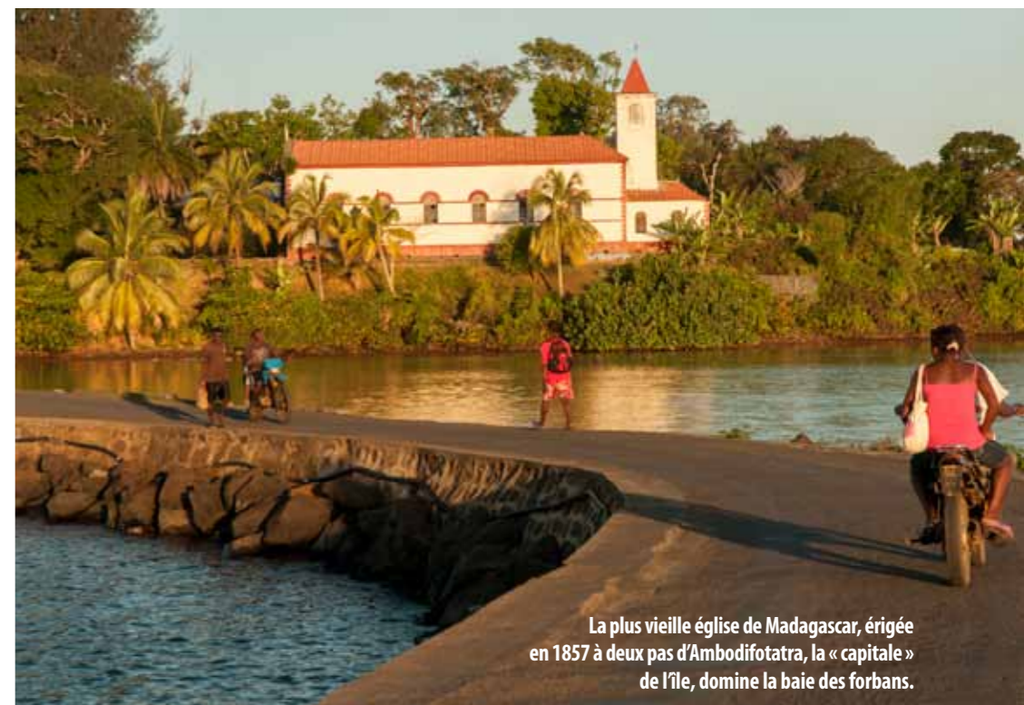
La plus vieille église de Madagascar, érigée en 1857 à deux pas d'Ambodifotatra, la « capitale » de l'île, domine la baie des forbans.

■ Forfait Saint-Valentin : à partir de 195 € par personne comprenant fleurs et chocolats à l'arrivée, une nuit en chambre double classique avec petit déjeuner buffet, un cocktail Rossini servi au bar et un dîner de trois plats avec une demi-bouteille de vin, eau minérale et café compris. Valable du 14 au 28 février. Rens. : +33 (0) 4 93 59 00 10 et ( lemasdepierre.com ).