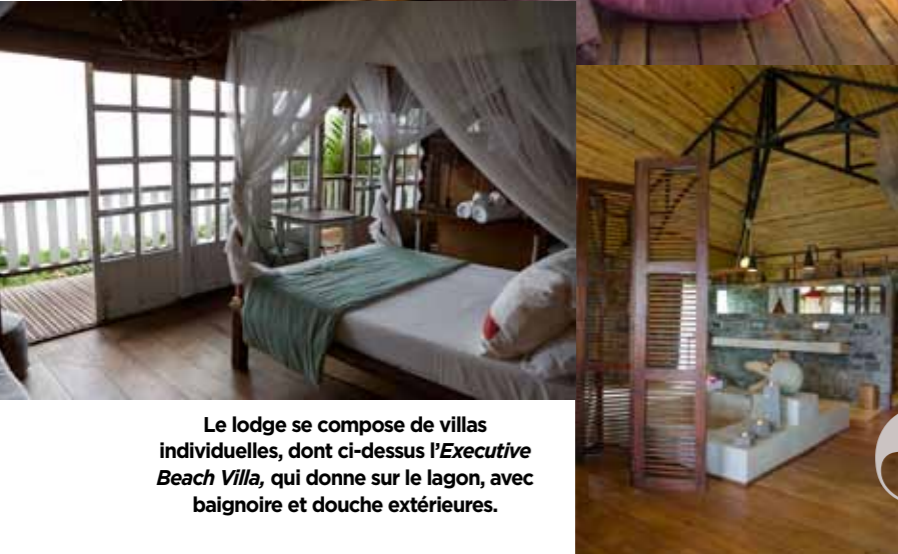
Le lodge se compose de villas individuelles, dont ci-dessus l'Executive Beach Villa, qui donne sur le lagon, avec baignoire et douche extérieures.