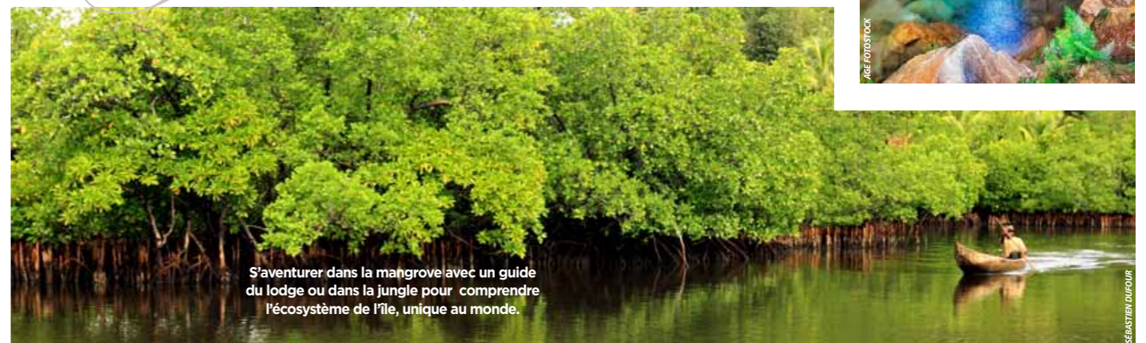
S'aventurer dans la mangrove avec un guide du lodge ou dans la jungle pour comprendre l'écosystème de l'île, unique au monde.